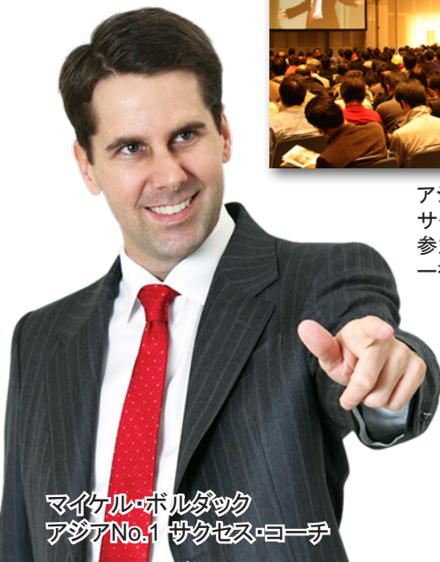
マイケル・ボルダック アジアNo.1 サクセス・コーチ